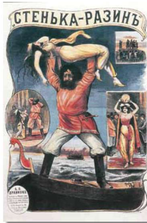
Поль Артуров. Стенька Разин. 1908. Из книги «Плакат немого кино», Арт-Родник, 2001