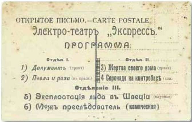
Реклама киносеанса, начало XX века