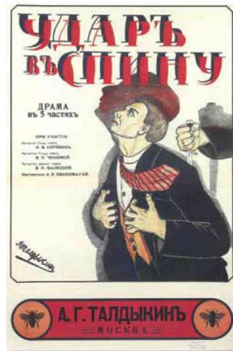
Александр Талдыкин. Удар в спину. 1917. Из книги «Плакат немого кино», Арт-Родник, 2001