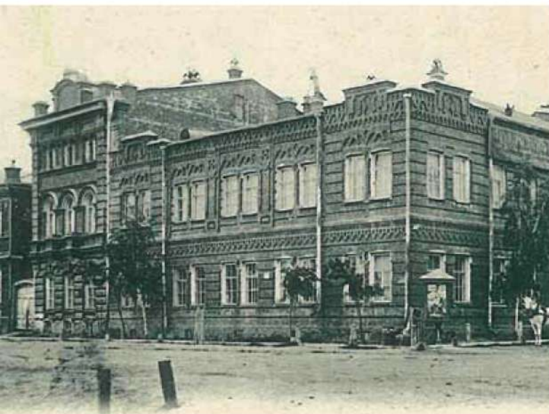
Бесплатная народная библиотека

Ещё одна интересная попытка «озвучить» фильм проведена в Томске в 1912 году. В связи со столетием Отечественной войны 1812 года владелец кинематографа «Художественный театр» перед началом фильма «Бородинский бой» разместил за экраном барабанщиков, горнистов, с десятком сторожей с трещотками и берданками, заряженными холостыми патронами. Позвали ребяташек с тазами и прочими «ударными инстру-