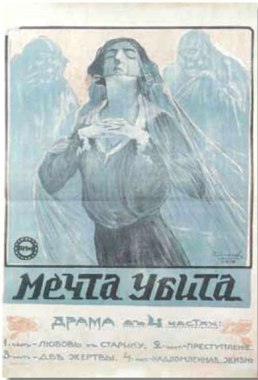
Георгий Алексеев. Мечта убита . 1910-е годы. Из книги «Плакат немого кино», Арт-Родник, 2001

Кроме театра кинематограф демонстрировался и в помещении Бесплатной народной библиотеки (позже кинотеатр им. И. Черных), и в доме Самохвалова на ул. Магистратской (теперь НИИ курортологии). Но это все разовые сеансы киногастролеров.