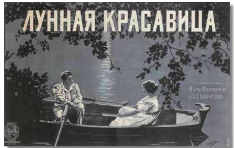
П. Житков. Лунная красавица. 1916.